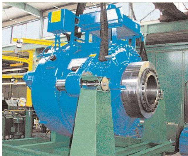
Renk stellt auch Getriebe für Windenergieanlagen her. Im Bild sehen Sie ein Getriebe für die REPower MD 70 Anlage!

Hier sehen Sie den kontinuierlichen Wachstumskurs von RENK seit dem Jahr 2000. Die Augsburger erobern die Weltmärkte!